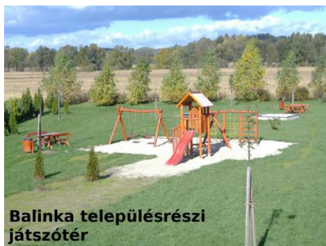
Balinka településrészi játszótér

(EMVA III. tengely - Falumegújítás és fejlesztés)