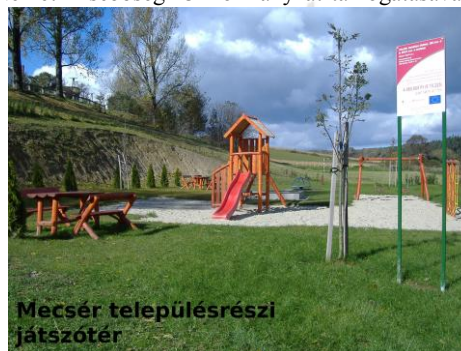
Mecsér településrészi játszótér

Mecséren a pályázat benyújtása előtt kialakítottuk a létesítendő játszótér helyét, míg Balinkán a Német Kisebbségi Önkormányzat támogatásával és munkájával már